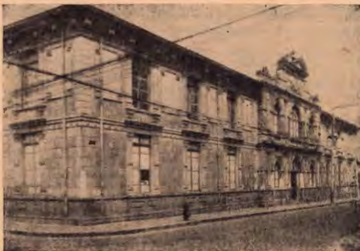
Elegante edificio que ocupa la Biblioteca Nacional