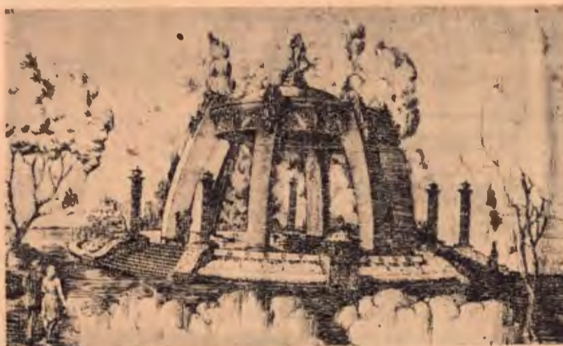
Templo de la Música en el Parque Central