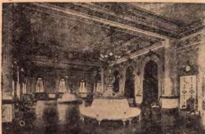
Foyer del T. Nacional, Monumento de Arte, orgullo de C. R.